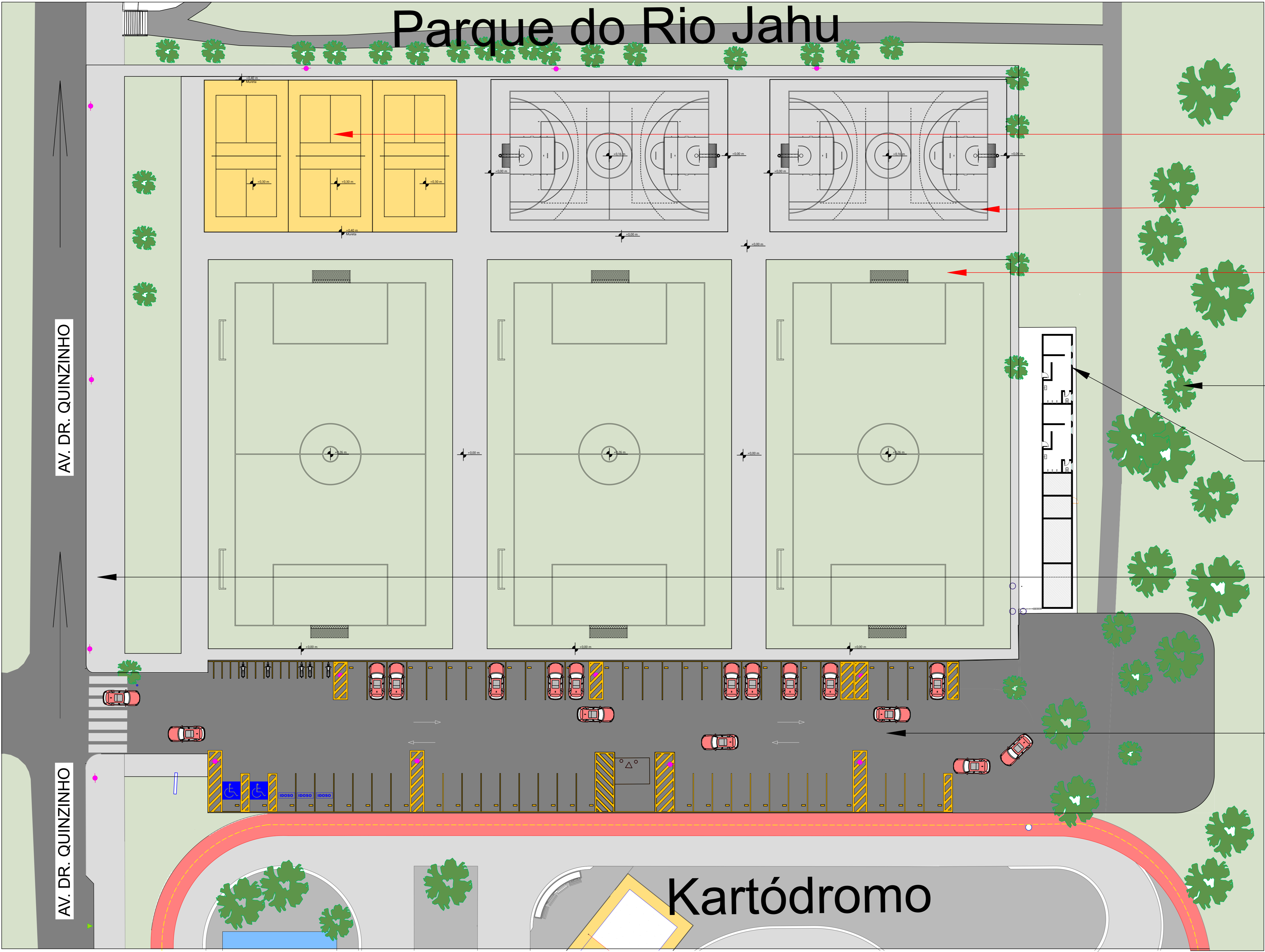
IMPLANTAÇÃO COMPLEXO ESPORTIVO ESC. 1:250